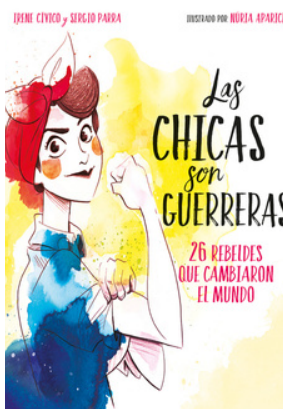
Las Chicas son Guerreras Irene Cívico (YA xS 920.72 C)