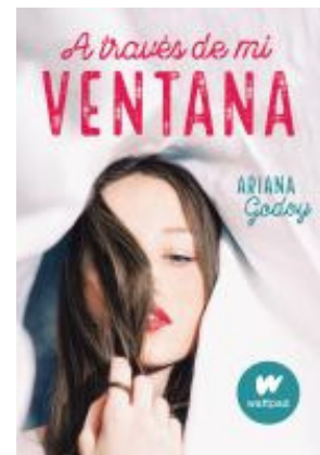
A Través de mi Ventana Ariana Godoy (xS YA GOD)