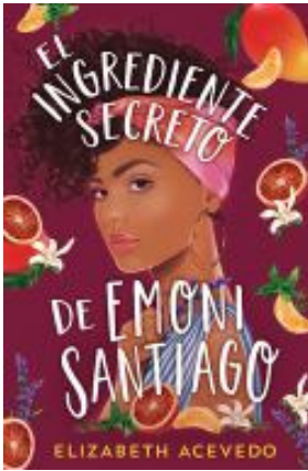
El ingrediente secreto de Emoni Santiago Elizabeth Acevedo (xS YA ACE)