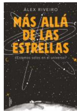
Más Allá de las Estrellas Alex Riveiro (YA xS 576.8 R)