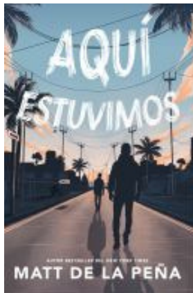
Aquí Estuvimos Matt de la Peña (xS YA DE)