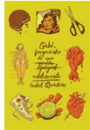
Gabi, Fragmentos de una Adolescente Isabel Quintero (xS YA QUI)