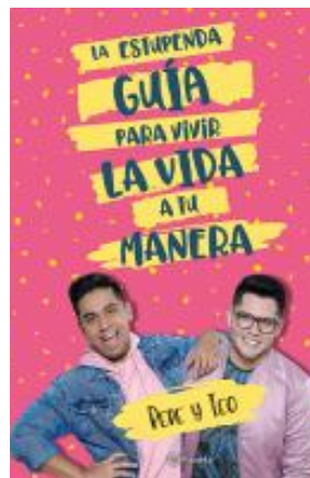
La Estupenda Guía Para Vivir la Vida a tu Manera Pepe y Teo (YA xS 306.76 P)