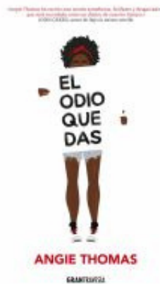
El odio que das Angie Thomas (xS YA THO)