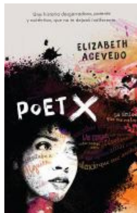
Poet X: Una Novela Elizabeth Acevedo (xS YA ACE)