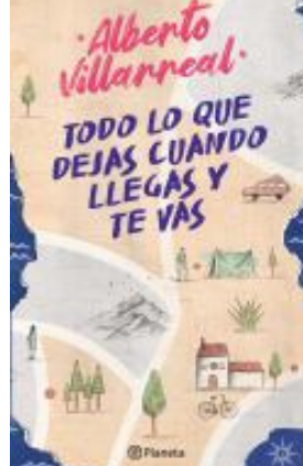
Todo lo Que Dejas Cuando Llegas y te Vas Alberto Villarreal (YA xS 861.7 V)